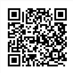
Abbildung 1: QR-Code zum Quelltext auf GitHub

Sie haben einen Fehler gefunden oder haben einen Verbesserungsvorschlag? Bitte eröffnen Sie ein Issue auf GitHub ( github.com/pojntfx/uni-netpractice-notes ):